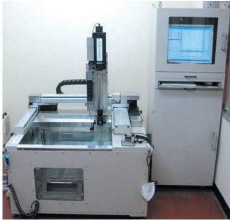
高速全波形収録を備えたオーダーメイド超音波水浸スキャンシステム