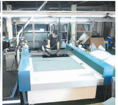
ミーリングマシンや自動枠組機

商業施設等にある置き型看板を主力製品とし、2,000種類を超えるオリジナル製品を年間約3万台、製造販売している。また自社製造の強みを生かしオーダーメイドにも1台から対応している。さらに近年はこれらの技術やノウハウを生かし、通常時は看板として情報発信や販売促進のツールとして使用でき、災害等の緊急時には車いすや台車、ストレッチャーとして使用できる新発想の非常搬送用可変式サインスタンド『サポートサイン』を開発・販売。TVや新聞