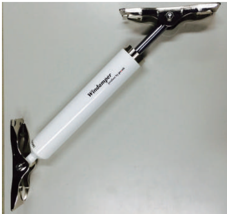
用途に応じたオイルダンパーを設計・製作