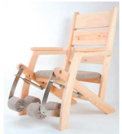
自社製品が採用された、高齢者用トレーニング機器

産業用ロボットや光学機器等に用いられるさまざまな精密部品の切削・マシニング加工を業務の主軸としている。緻密な加工技術もさる事ながら、同社が他の部品メーカーと一線を画すのは、独自の開発力だ。「製造を考えた開発」「開発コンセプトを意識した製造」を追求し、顧客のニーズを超えた提案や自発的な合理化を実践している。切削加工と組み立ての他に、同社がもう一つの柱とするのが機構部品の開発である。小規模企業ならではの機動性を駆使し、さ