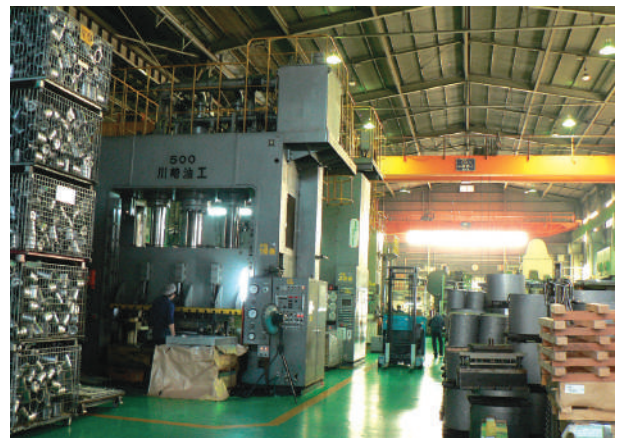
充実した機械設備を誇る工場内

金属プレス加工、精密プレス金型設計製作など、さまざまなメーカー品の基盤製造を手掛けている。工場にはプレス機械、レーザー加工機、ターレットパンチプレス、溶接機、ボール盤、マシニングセンター、NC旋盤、研磨機などが充実。あらゆる金属加工に対応するが、特に得意とするのは圧力容器の絞り加工だ。鉄のパイプもコストのかかる鉄管ではなく、鉄板をカットしてプレスで輪にしてプラズマ溶接で仕上げている。また顧客の要望にすばやく応えるため、常に約1,000t以