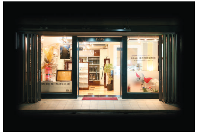
神戸本社ショールーム

ステンレス材1mmの板厚に対して0.75mmの孔径、1.5mmのピッチといった精緻なプレス加工を可能にした技術が「スーパーパンチング™」である。従来のパンチングプレス加工では金属の厚みより孔径が小さいもの、ピッチが細かいものは困難とされてきた。それに挑戦を初めたのは堺のユニパンチ工業と経営統合したことから。ユニパンチ工業が得意としていた小孔径のパンチングプレス加工技術を継承し、さらに磨きをかけてきた。そうして完成した「スーパーパン