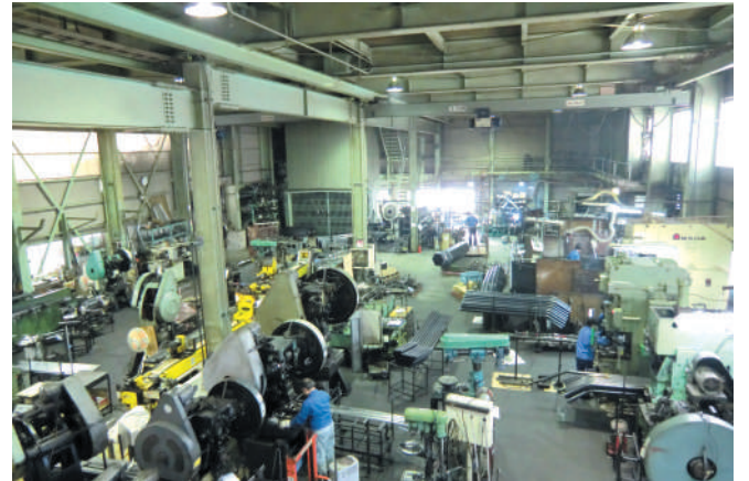
大きなサイズの加工にも対応できる広い工場内

様々な形状や素材のパイプを加工できるだけでなく、内側にしわのない美しい曲げ部や、三次元の複雑な形状を可能とする事から、多くの業界から加工技術を評価されているタイガー製作所。曲げ加工から溶接までを一貫生産できるのも魅力だ。全プロセスで高い技術を誇っているので完成度の高い製品が安定して供給でき、分業による意思の乖離がなく横持ち運賃もかからない。パイプ加工の職人と溶接の職人が集まり、図面や試作品を確認しながら綿密な打合せ