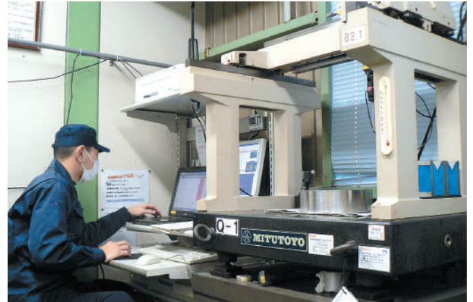
専用の検査室で品質チェック

私たちの身の回りにある工業製品のほとんどは金型を使って作られている。金型は効率よく大量生産を行う為の道具で、製品の品質や性能を左右する重要な要素だ。金型が物づくりの根幹と言えるだろう。これまでアイエムデー工業は弱電関係の金型を手掛けてきた。現在はオートバイの部品の金型を中心に様々な金型を製作し、アメリカやイギリス、ベトナム等の各国へ送り出される。「世界中のどこでも誰でも精度の高い製品が作れる、そんな金型を作る事が弊社